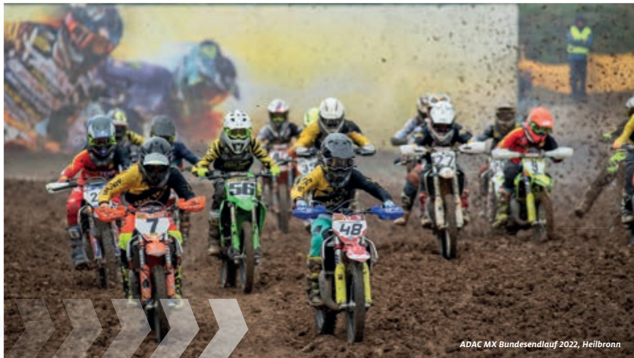
ADAC MX Bundesendlauf 2022, Heilbronn