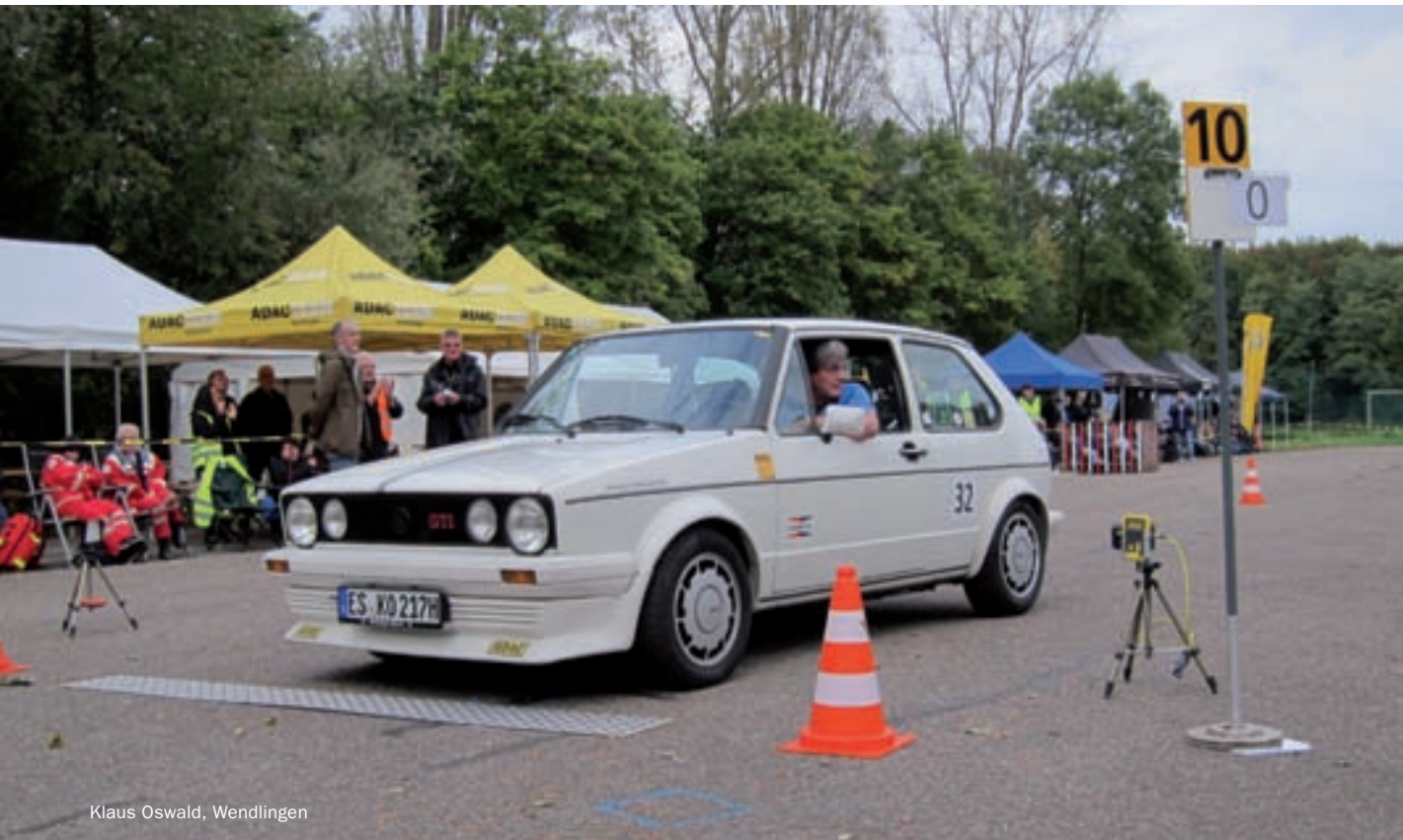
Klaus Oswald, Wendlingen