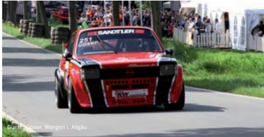
Günter Göser, Wangen i. Allgäu